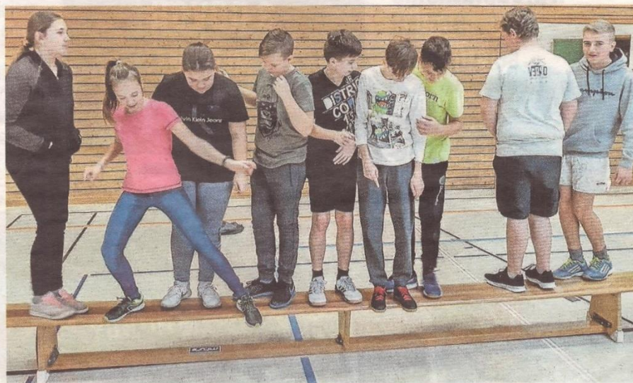
SOUČÁSTÍ výjezdu českých sedmáků byly sportovní hry a soutěže.