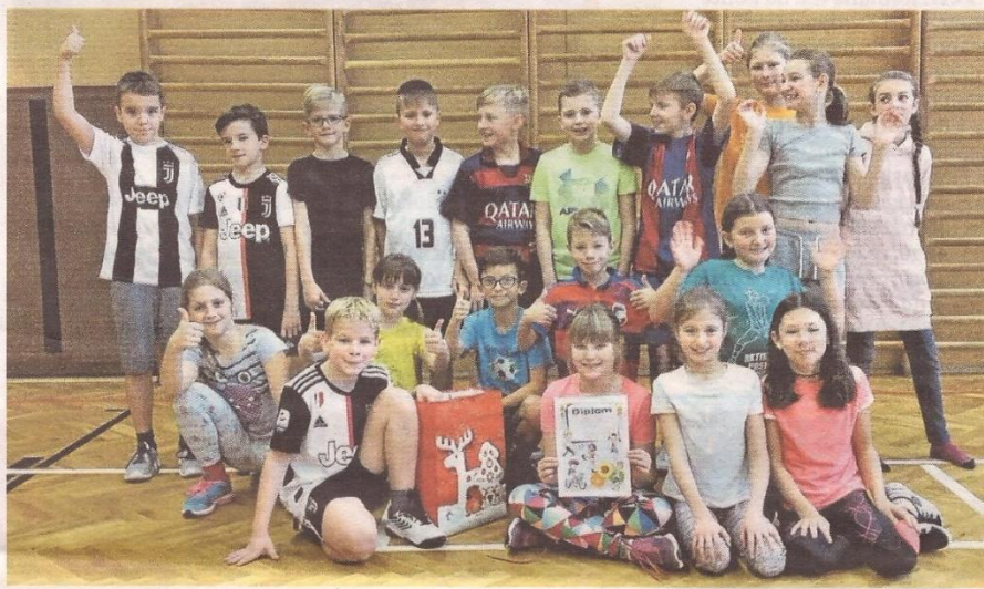
NĚKTEŘÍ z účastníků vydařeného turnaj ZŠ TGM ve vybíjené.

Dodejme, že školáci z 'Masaryčky' se zapojili i do jiných projektů. Pomohli shromáždováním hraček kamarádům v dětském domově a přímo v areálu ZŠ sbírali vyloučené elektrospotřebiče nebo starý papír. (da, lr)