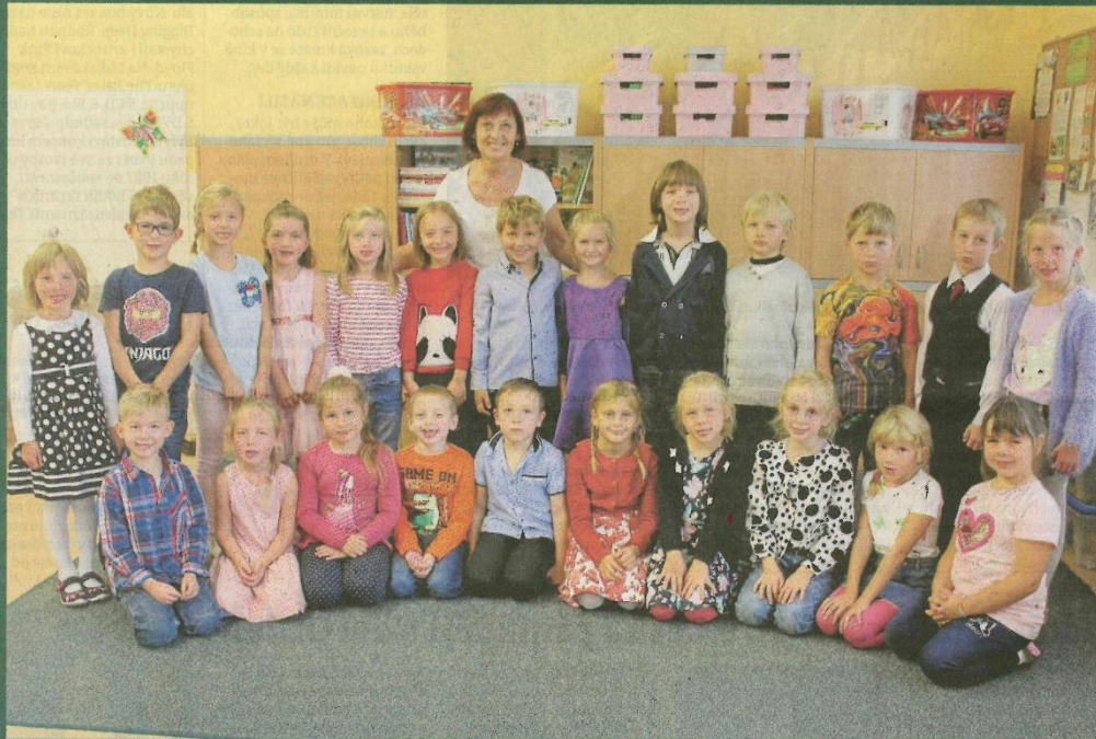
Děti z 1.A ZŠ TGM Rokycany.