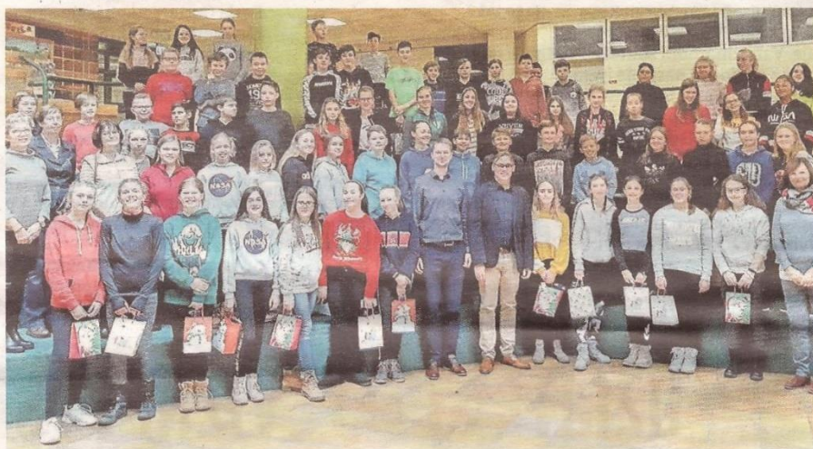
SOPEČNÝ SNÍMEK z prosincového setkání v německé škole.