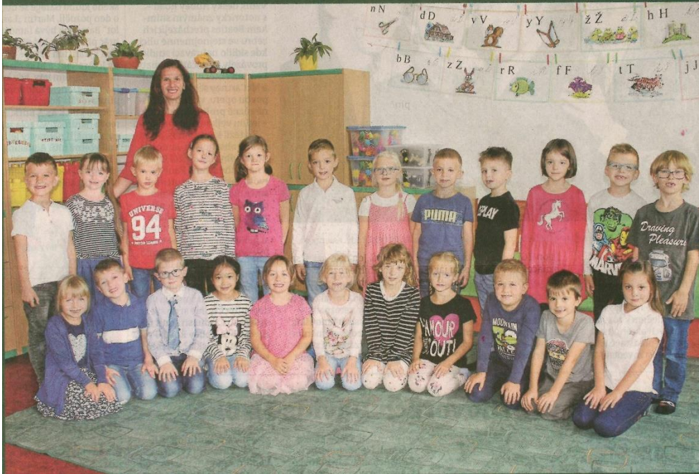
Děti z 1. B ZŠ TGM Rokycany.

Rokycany - Základní škola TGM v Třebízského ulici je školou pro 470 žáků. Součástí školy je družina a školní jídelna. ZŠ se dlouhodobě věnuje rozšířené výuce cizích jazyků. S angličtinou začínají žáci již v 1. třídě, od šeste si volí další cizí jazyk. Němčinu si procvičují i při setkáních s partnerskou školou v SRN nebo během exkurze do Paříže a Londýna. Na vysoké úrovni je i výuka ostatních předmětů, k tomu pomáhá také technické vybavení školy. Využívají se dvě počítačové třídy, jazyková a tabletová učebna i cvičná kuchyňka. Ve třídách jsou interaktivní tabule. Dva pěvecké sbory se úspěšně účastní pěveckých přehlídek. Samozřejmostí je organizace kurzů plavání, lyžování, bruslení a dopravní výchovy. ZŠ každoročně připravuje několik celoškolních akcí, kterých se mohou účastnit rodiče i veřejnost. Školu řídí Lukáš Rada. Partu I. B., kterou představujeme, vede učitelka Blanka Minaříková.