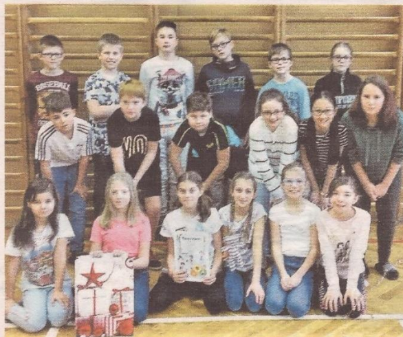
VYBÍJENÁ je ideálním sportem pro kluky i děvčata.