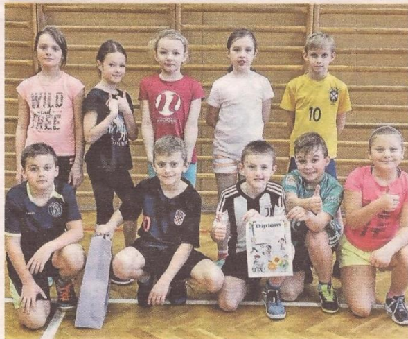
DIPLOMY a ceny patřily všem zúčastněným družstvům.